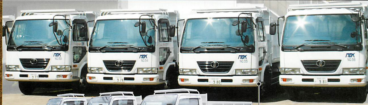
3t リヤダンプ (深ボディ) BDG-NKR85AN-EJ5MADY-M