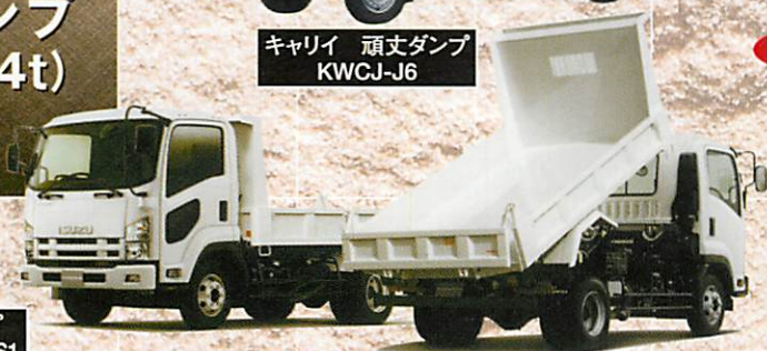
4t 強化ダンプ PKG-FRR90S1