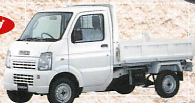
キャリイ 頑丈ダンプ KWCJ-J6