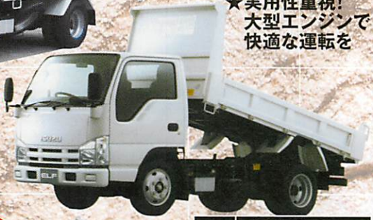
3方開 強化ダンプ (3方開)