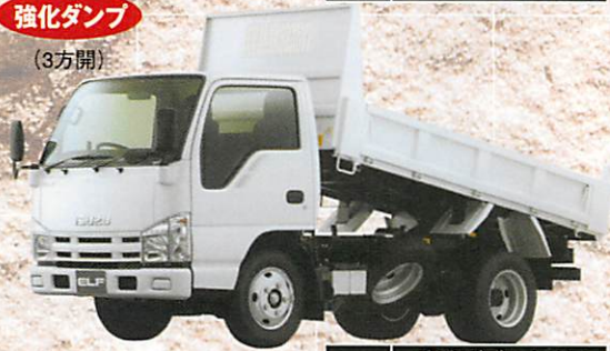
3t 高床ダブルタイヤ BDG-NKR85AD-EJ5MAK5-M