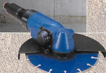
コンクリートカッター TAG-900G