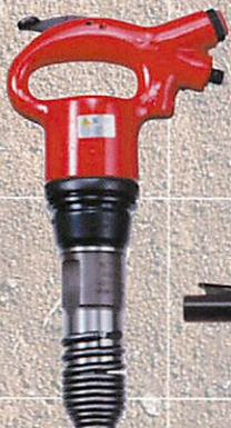
ライトピックハンマ AA-3B