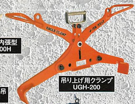
吊り上げ用クランプ UGH-200