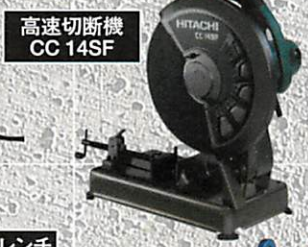
高速切断機 CC 14SF