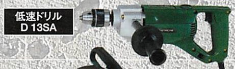
低速ドリル D 13SA