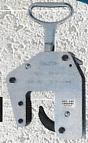
間知ブロックマツメ吊 KBC500W