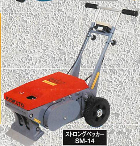
ストロングベッカー SM-14