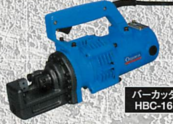
バーカッター HBC-16 II