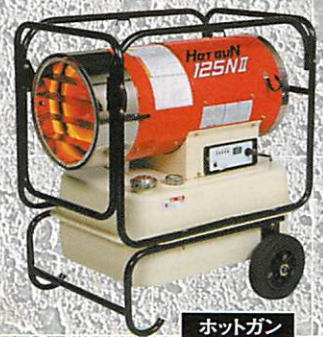
ホットガン HG125N II