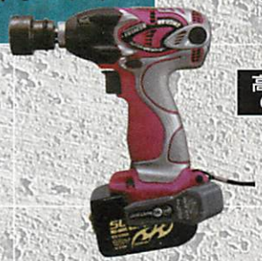
コードレスインパクトレンチ WR 12DM2