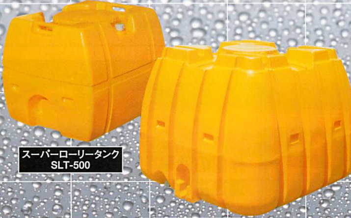
スーパーローリータンク SLT-500