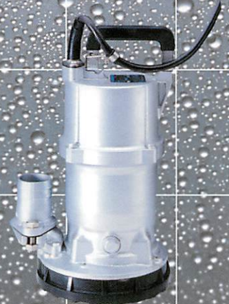
残水排水用ポンプ EQS