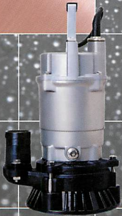
排水用水中ポンプ EX2