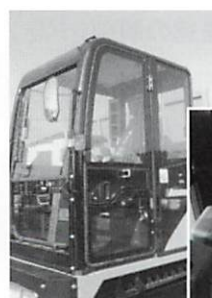
◀ キャビン標準装備