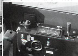
集中モニターなど安全設計